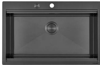
Spülbecken Milanello Gun Metal Workstation 1034 056